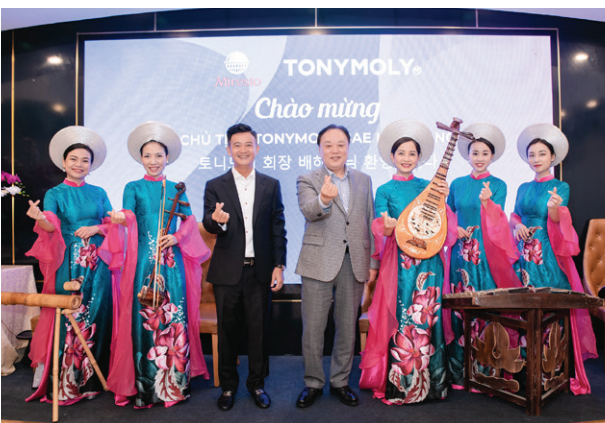
Chủ tịch Miresto đón tiếp Chủ tịch Tập đoàn Tonymoly Founding Chairman of Miresto welcomes Chairman of Tonymoly Corporation