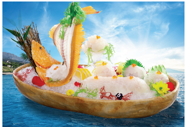
Thuận Buồm Xuôi Gió - Cá Bơn Vàng Golden Flounder Sashimi