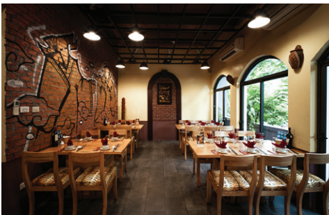
Số 9 Hàn Thuyên, Hai Bà Trưng