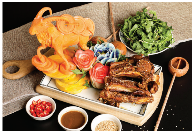
Sườn Dê ré nướng Roasted Goat Chops