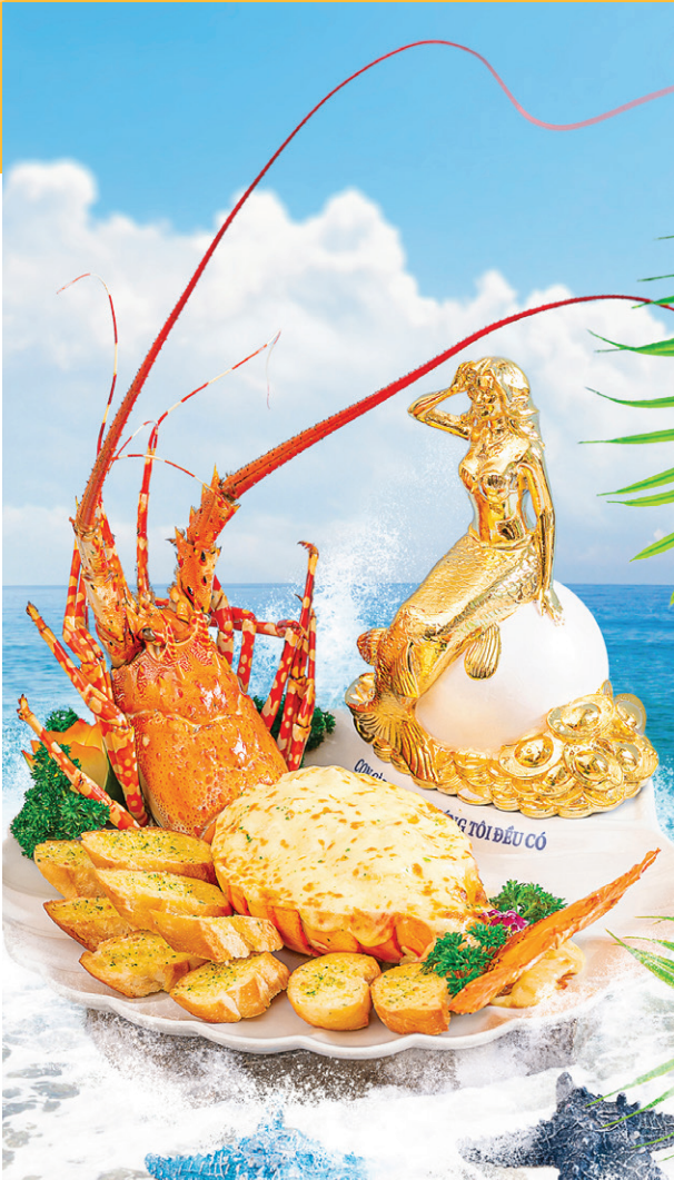
Lộc Biển Phát Tài - Tôm Hùm Bông Nha Trang Baked Nha Trang lobster with cheese