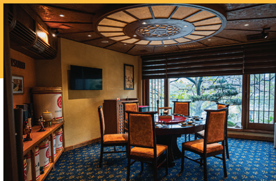
Số 2 Vạn Phúc, Ngọc Hà, Hà Nội