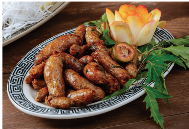
Lòng dôi dê ré Goat Intestine, Sausage