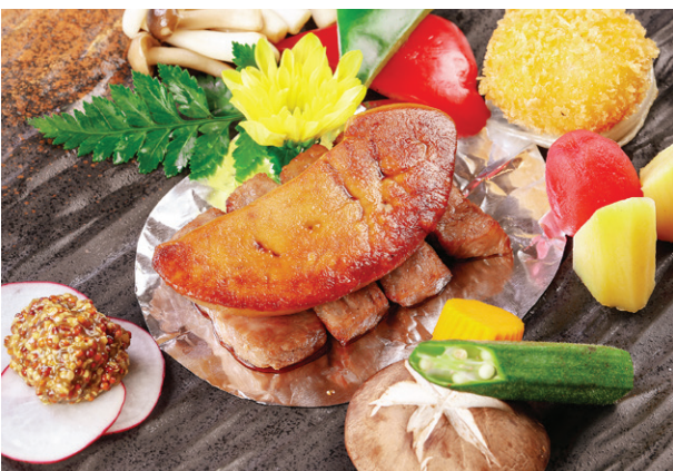
Samurai Grilled Foie Gras & Kobe Beef