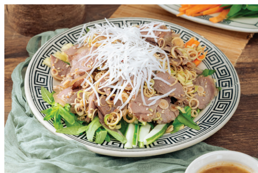
Dê ré tái chanh / Rare goat with Lemon