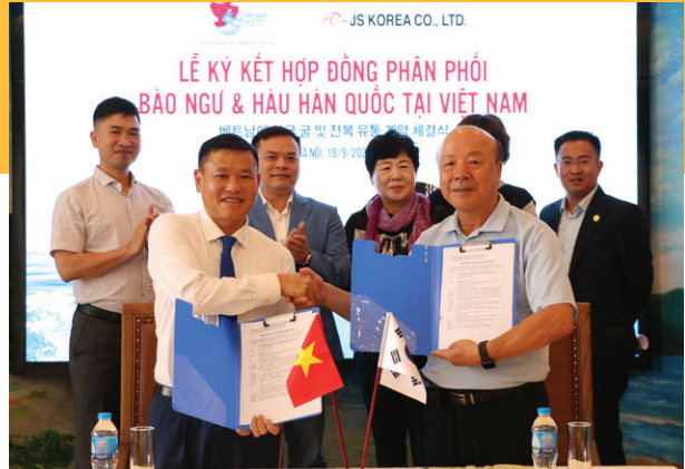
Lễ ký kết hợp đồng phân phối Bào ngư & Hàu Hàn Quốc Signing ceremony of distribution contract for Korean Abalone & Oysters