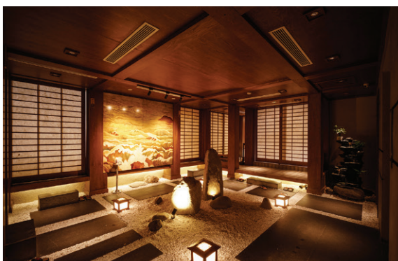
39 Nguyễn Chánh, Yên Hòa, Hà Nội