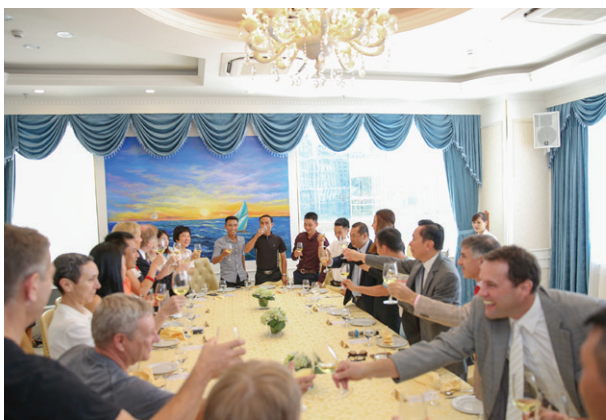
Tiệc tiếp đón các vị Đại sứ và khách quý tại Thế Giới Hải Sản Welcome party after the expedition of Son Doong