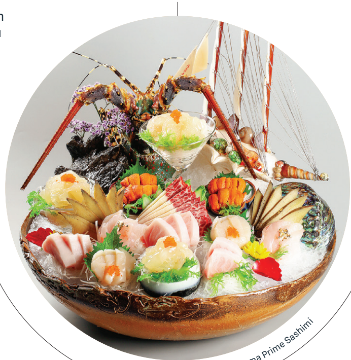
Hatoyama Prime Sashimi