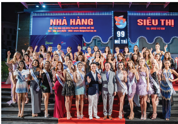
Tiếp đón thí sinh tham dự Cuộc thi hoa hậu Cosmo 2024 Welcomes The Contestants of The Miss Cosmo 2024 Pageant