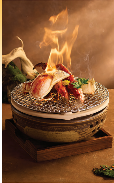
Chân cua King Crab nướng than Binchotan