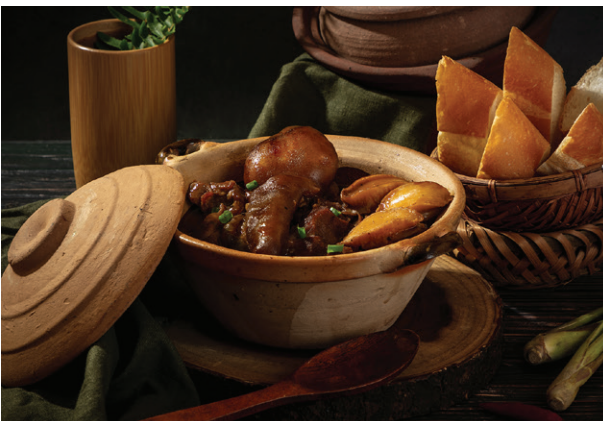
Sơn Hải Song Tinh Goat Testicle Stewed with Abalones