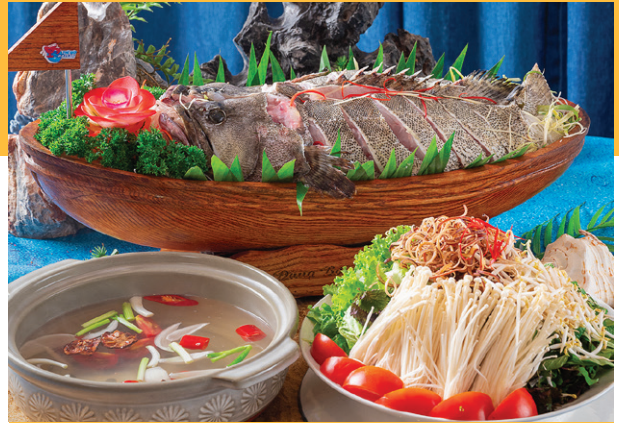
Lẩu Thuyền Chài Cá Song Trân Châu Fisherman Hotpot