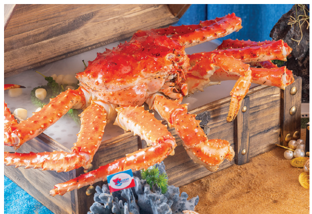
Cua Hoàng Đế hấp rượu vang King Crab Steamed