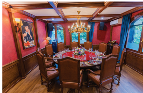
36 Điện Biên Phủ, Ba Đình