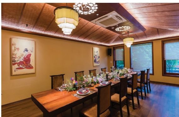
36 Điện Biên Phủ, Ba Đình, Hà Nội