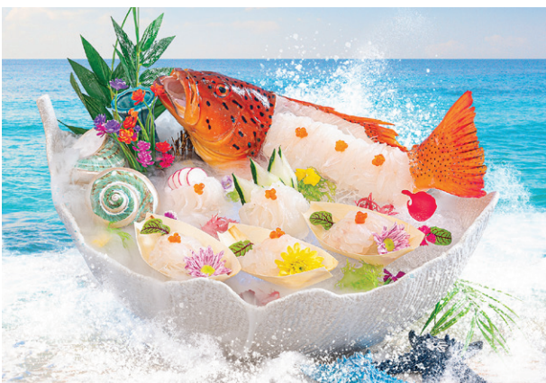
Sashimi Song đỏ Red Grouper Sashimi