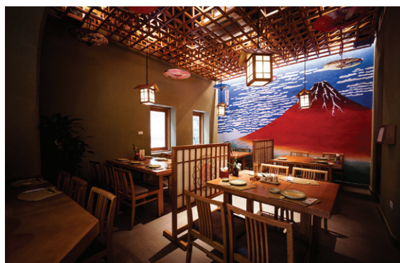
13 Lý Thường Kiệt, Cửa Nam, Hà Nội