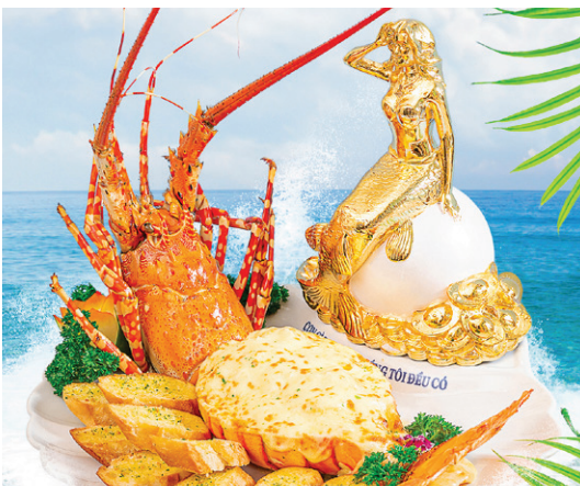
Món ăn văn hoá Lộc biển phát tài - Tôm hùm bông Sea Fortune cultural dish - Baked lobster with cheese

Không chỉ trân trọng từng giá trị trong nền ẩm thực nước nhà, Thế Giới Hải Sản đã góp phần quảng bá, giới thiệu những món ăn đa dạng, mang cả tinh hoa, "Quốc hồn Quốc túy" của ẩm thực Việt đến bạn bè quốc tế.