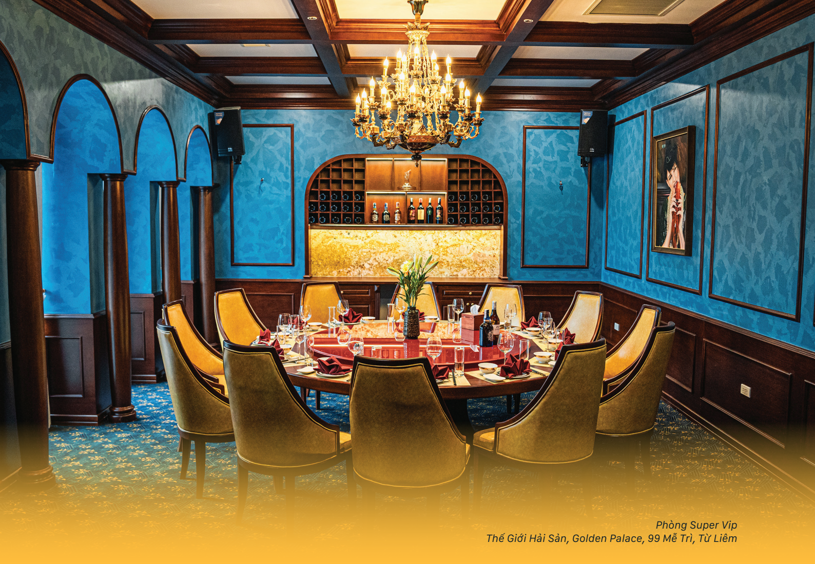
Phòng Super Vip Thế Giới Hải Sản, Golden Palace, 99 Mỹ Trì, Từ Liêm