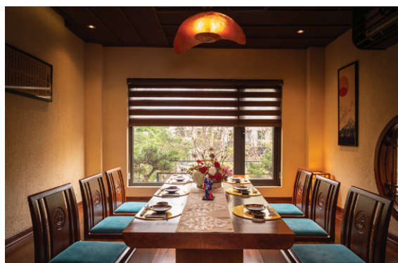
BT-F09 Ngoại Giao Đoàn, Tây Hồ Tây, Xuân Đình, Hà Nội