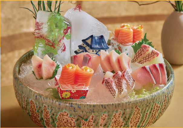
Sashimi Kyoto tổng hợp Mixed Sashimi: Tuna, Salmon, Sea Bream & Scallop