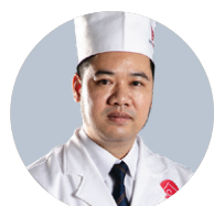
Mr. Kyo Executive Chef