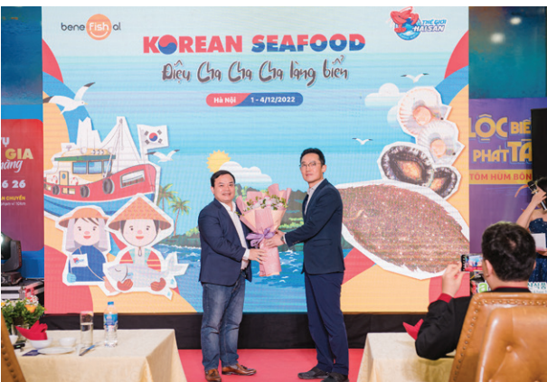
Sự kiện giới thiệu và quảng bá Hải sản Hàn Quốc Event to introduce and promote Korean Seafood