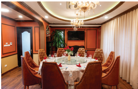
60 Vũ Trọng Khánh, Hà Đông