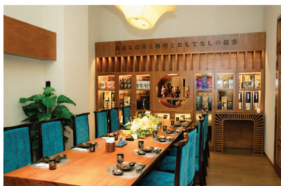
Pearl River Hotel, Km8 Phạm Văn Đồng, Hưng Đạo, Hải Phòng