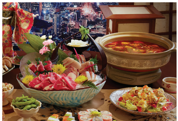
Lẩu mùa xuân Haru Haru Spring Hotpot: Fresh Beef & Buri Fish