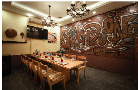
Số 9 Hàn Thuyên, Hai Bà Trưng