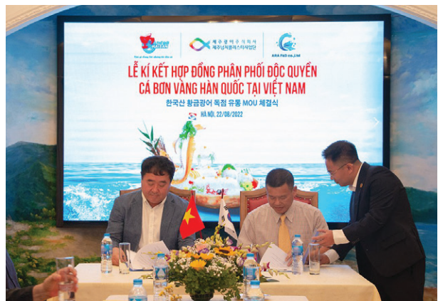
Lễ ký kết hợp đồng phân phối độc quyền Cá bơn vàng Hàn Quốc tại Việt Nam Signing ceremony of exclusive distribution contract of Golden Flounder