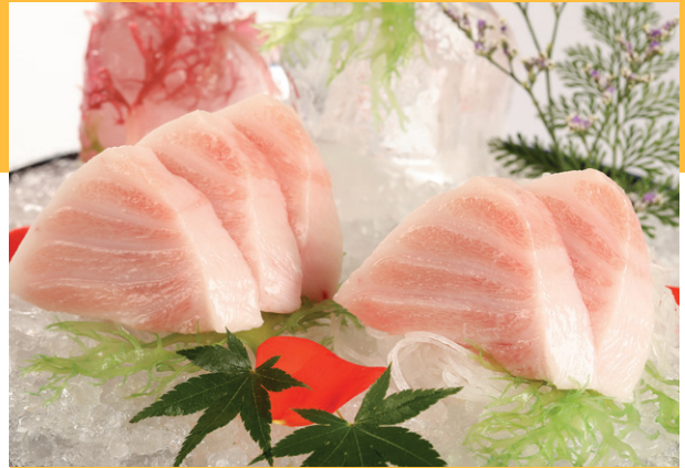
Sashimi Bụng cá ngừ Otoro Sashimi