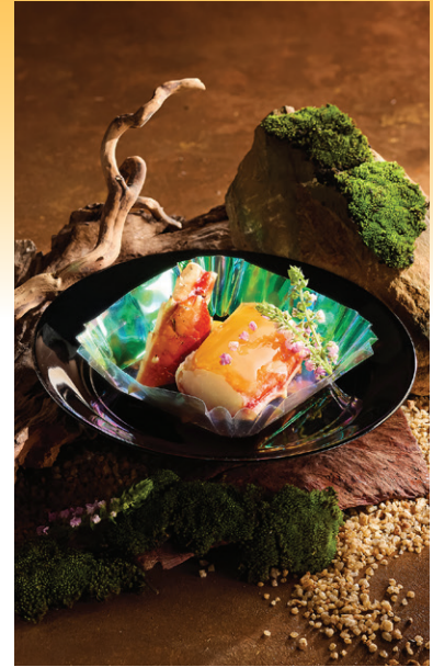
Chân cua King Crab phủ thạch mỹ vị