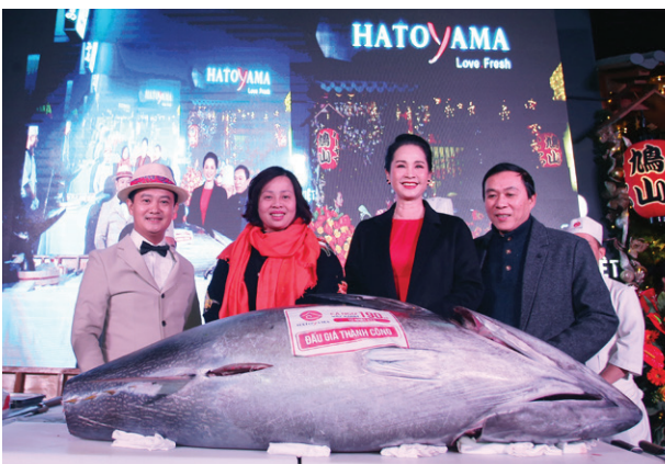
Các vị khách quý tại sự kiện Xẻ cá ngừ 190kg Distinguished Guests Attended The 190kg Tuna Fish Filleting Ceremony at Hatoyama 13 Ly Thuong Kiet