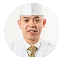
Chef Fuku Taste of Japan Certification