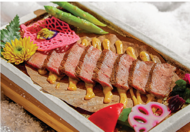
Lưỡi bò Wagyu nướng sốt miso trên lá mộc lan Grilled Wagyu Tongue with Miso Sauce on Hoba Leaf