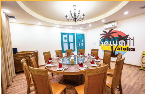
18 Trần Kim Xuyên, Yên Hòa