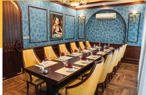
75A Trần Hưng Đạo, Cửa Nam