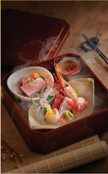
Sashimi 5 vùng biển