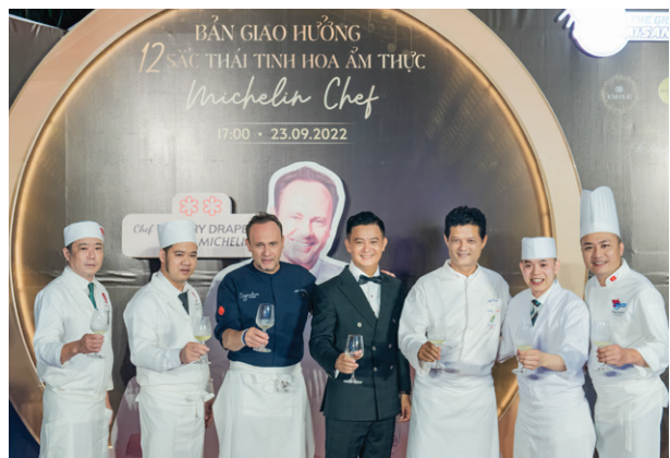
Sự kiện Bản giao hưởng 12 sắc thái tinh hoa ẩm thực Michelin The symphony of 12 shades of quintessential culinary by Michelin chef