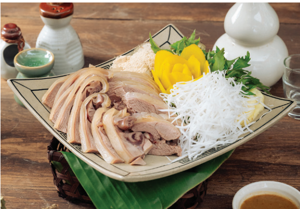
Dê ré ủ trấu Rice-husk Incubated Goat