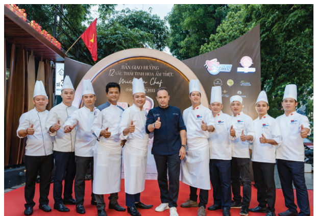
Sự kiện Bàn giao hưởng 12 sắc thái tinh hoa ẩm thực Michelin The symphony of 12 shades of quintessential culinary by Michelin chef