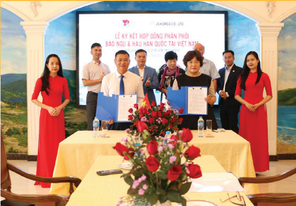
Lễ ký kết hợp đồng phân phối Bào ngư & Hàu Hàn Quốc Signing ceremony of distribution contract for Korean Abalone & Oysters