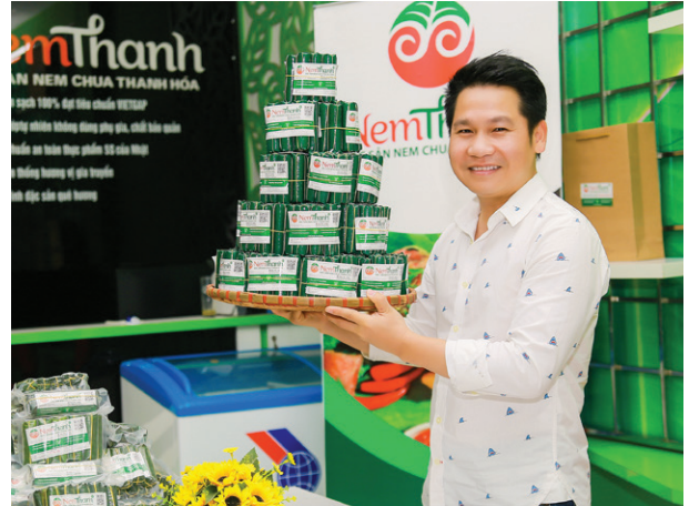
Ca sĩ Trọng Tấn và Nem Thanh Singer Trọng Tấn and Nem Thanh

Nem Thanh believes that quality products would undoubtedly affirm its position in the marketplace, and pride in our homeland cuisine - spreading Thanh province culture both inside and outside of the country using the esteemed trust of valued customers.