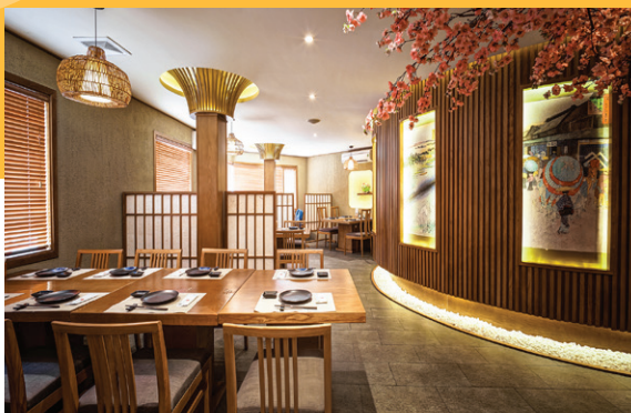
Số 8 Vạn Phúc, Ngọc Hà, Hà Nội