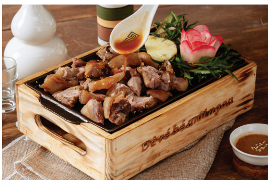
Dê ré nướng tảng / Baked goat

With its artistic architecture space, delicious food, a rich menu, and a team of dynamic and dedicated service; "De Re" Song Duong specialty restaurant promises to bring diners delightful meals and memorable moments alongside their friends, colleagues, or beloved ones.