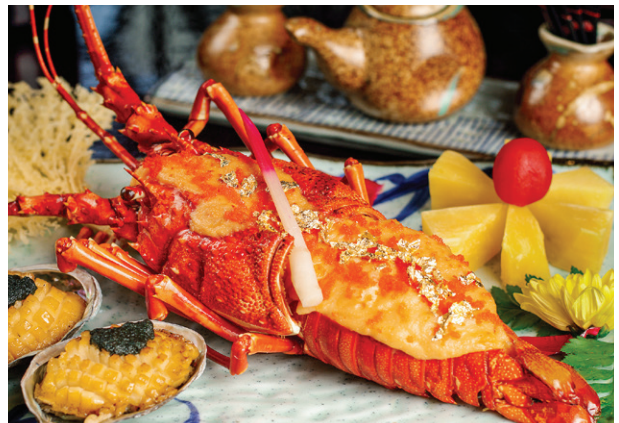
Tôm hùm xanh bò lò phô mai phủ vàng Gold fold Green Lobster Grilled