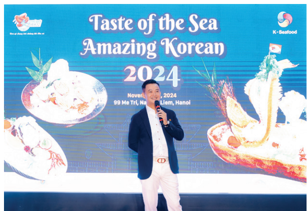
Sự kiện Lễ hội hải sản Hàn Quốc Korean Seafood Festival event